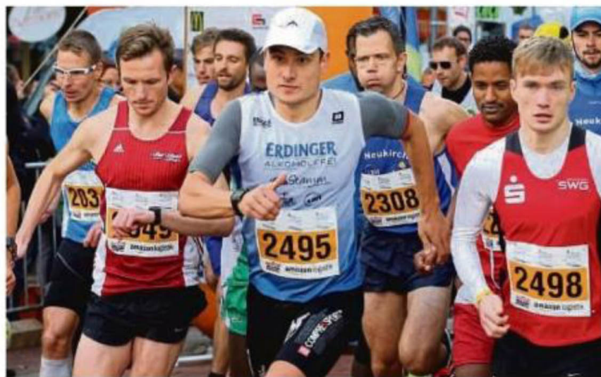
So soll es in diesem Jahr wieder sein: Unser Foto entstand beim Lollslauf 2019 und zeigt die Szene vom Halbmarathon – vor Ausbruch der Pandemie.