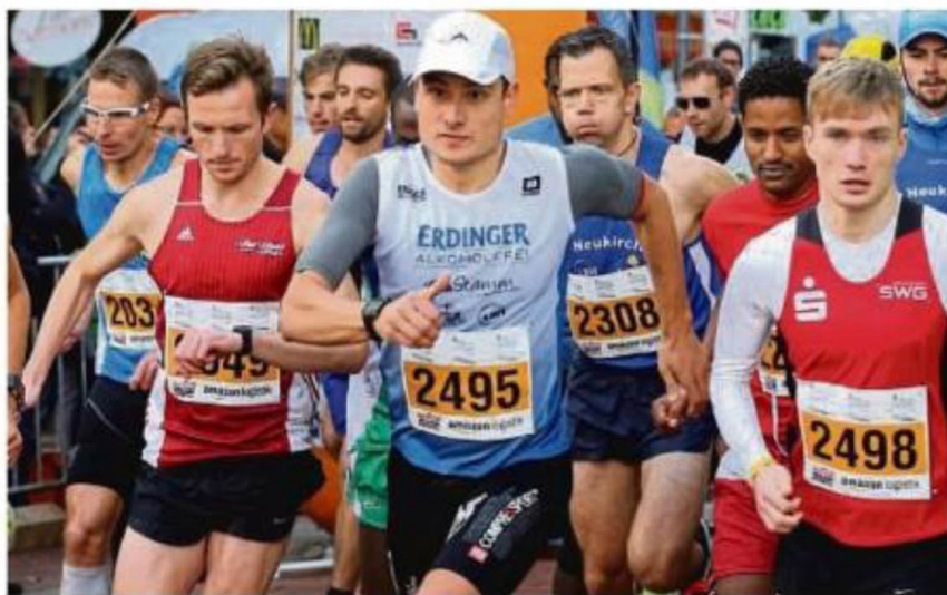
So soll es in diesem Jahr wieder sein: Unser Foto entstand beim Lollslauf 2019 und zeigt die Szene vom Halbmarathon – vor Ausbruch der Pandemie.